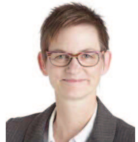
Andrea Weise Kliniken Valens

«Unsere Motivation als Forscherinnen ist es, die Praxis darin zu unterstützen, wirksame, wirtschaftliche und an die Bedürfnisse von Menschen mit Multipler Sklerose angepasste ergotherapeutische Behandlungen anzubieten.»