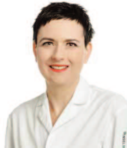
Franca Wagner Inselspital, Bern

Dadurch sollen zukünftig die Differenzen in der MRT-Bildbefundung und der Verlaufsbeurteilung der MRT-Bilder von MS-Patienten in Hinblick auf die MS-Läsionslast, Krankheitsaktivität und insbesondere des Hirnvolumens als Parameter zur Erfassung der Krankheitsprogression vermieden werden. Dies hat spezielle Bedeutung für den Langzeitverlauf und die Therapie der MS-Patienten, da die messbaren Veränderungen des Hirnvolumens ein Prädiktor für kognitive Beeinträchtigungen und Leistungseinschränkungen sind. Ein zunehmender Verlust von Hirngewebe aufgrund des Fortschreitens der MS kann allein durch eine reine visuelle MRT-Bildanalyse nicht ausreichend beurteilt werden. Die Überwachung der Krankheitsprogression und des Verlaufs sowie die Therapiekontrolle erfordern einen objektiven Ansatz zur Abschätzung der MS-Läsionslast und der Hirnatrophie bei MS-Patienten. Ein dementsprechender Ansatz ist die automatisierte objektive Bildanalyse zur Bestimmung der MS-Läsionslast und Beurteilung der Hirnatrophie im Krankheitsverlauf.