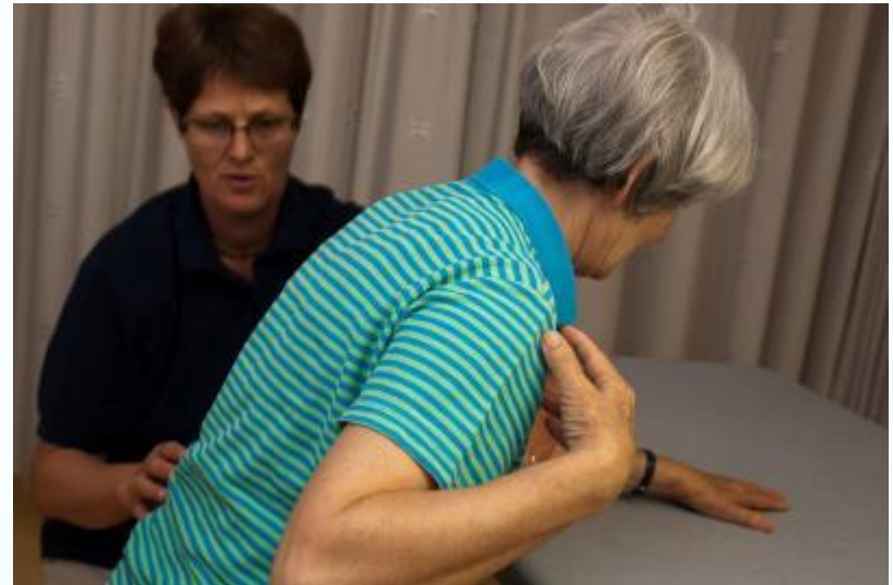
Abb. aus Steinlin Egli, R. (2011). Multiple Sklerose verstehen und behandeln. Springer