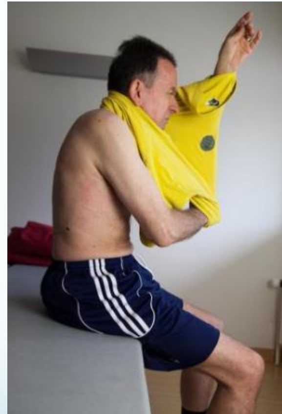
Abb. aus Steinlin Egli, R. (2011). Multiple Sklerose verstehen und behandeln. Springer