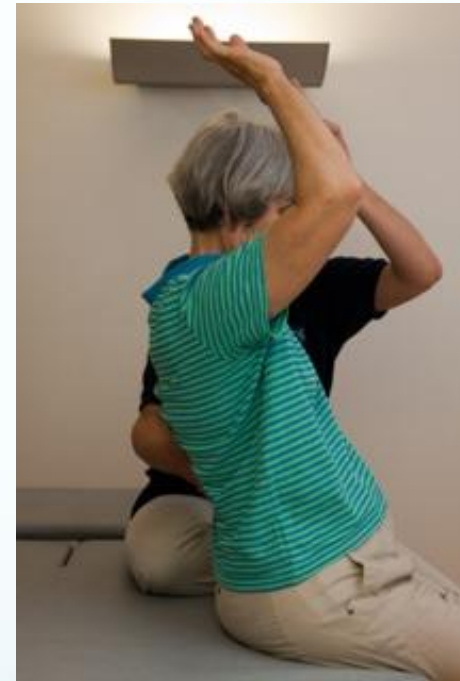
Abb. aus Steinlin Egli, R. (2011). Multiple Sklerose verstehen und behandeln. Springer