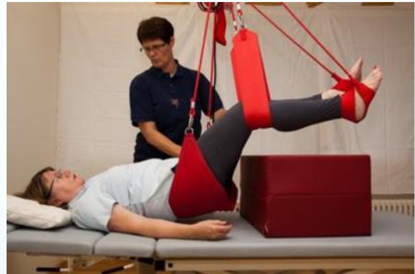
Abb. aus Steinlin Egli, R. (2011). Multiple Sklerose verstehen und behandeln. Springer