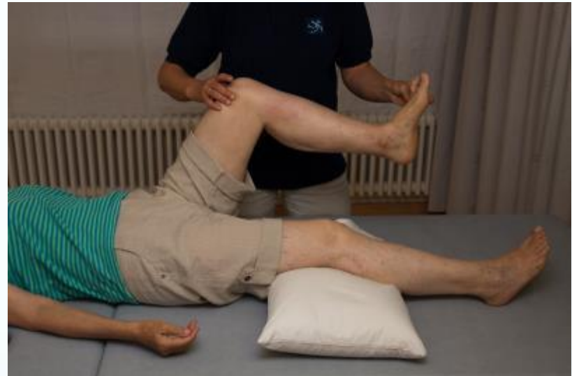
Abb. aus Steinlin Egli, R. (2011). Multiple Sklerose verstehen und behandeln. Springer